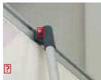
Barres clipsante + tête en plastique

Plus besoin de nous renvoyer votre structure ! Grâce à la bannière L double vous remplacez votre visuel vous même en une seule opération. Cette structure convient parfaitement aux multiples lieux de vente. Il permet une installation rapide et facile. Il est parfaitement adapté aux événements intérieurs et convient à un usage répétitif. Livré avec un tube de protection et un sac tissu. Design soigné et poids léger. Impression maintenue par barres clipsantes, réutilisable à volonté.