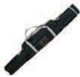
Sac rembourré avec tube en carton à l'intérieur