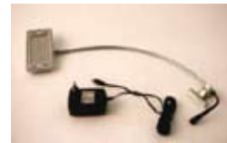
Lampe LED pour enrouleur 78 ampoules = économies d'énergie