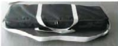
Sac en canevas et carton individuel