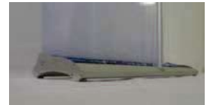
Nouveau Design épuré