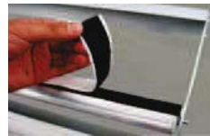
Système velcro pour un changement de visuel facilité