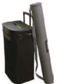
Valise à roulettes livré avec le comptoir double