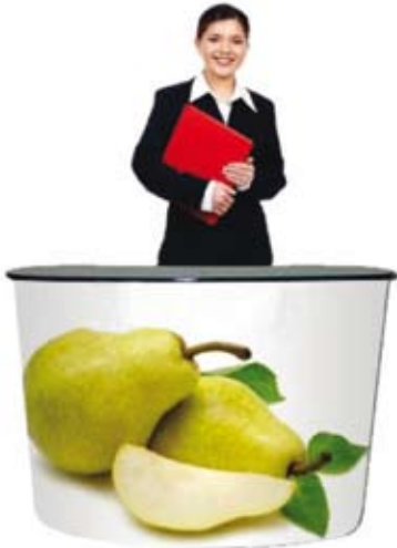
Comptoir Double MAPP10122W