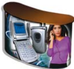
Comptoir double MAPP10122W-P