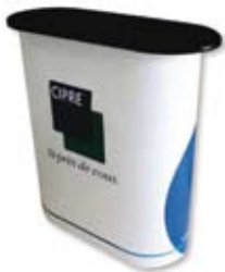
Comptoir Simple MAPP10100W